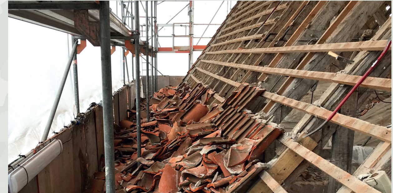
Reparationer af Tune Kirke både inde og ude har kostet mange penge

21-04-25 kl. 10.30 Påskevandring Kristine Nymann